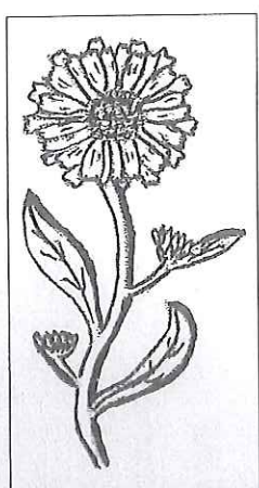
キンセンカ Calendula officinalis 静脈瘤、皮膚病に効果

お問い合わせ・お申し込み 〒891-4205 鹿児島県熊毛郡上屋久町宮之浦2452 電話 0997(42)0703